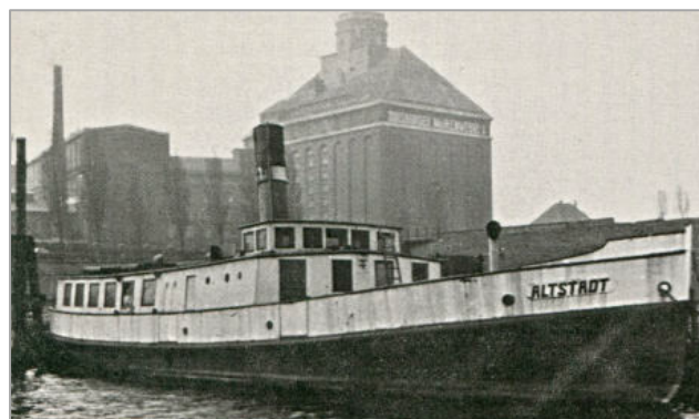
Altstadt im Königsberger Hafen

Im Jahre 1927 lief die „Wappen von Schleswig“ (ehemalige „Altstadt“) in Königsberg als Eisbrecher und Schlepper vom Stapel. Am Ende des 2. Weltkrieges wurde das Schiff mit über 200 Menschen als Flüchtlingstransporter eingesetzt.